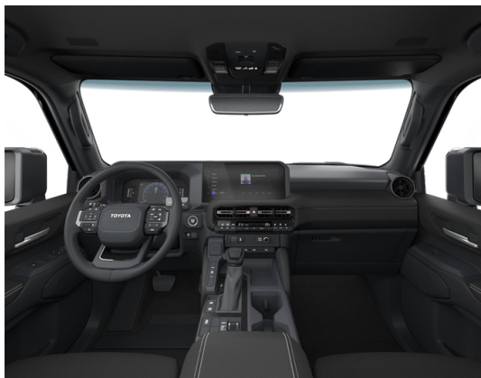
Кара түстөгү жасалма булгаары (EA20) "Комфорт+" комплектациясы