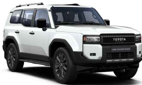
Ак бермет (089)