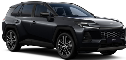
Чёрный металлик (218)