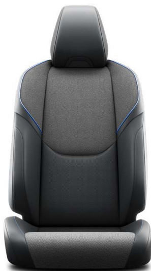
Форма: Спорт Цвет: Чёрный Материал: Комбинированный (замша + кожа), акцентирующие линии синего цвета Комплектация: "Style"