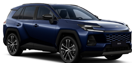
Тёмно-синий металлик (8X8)