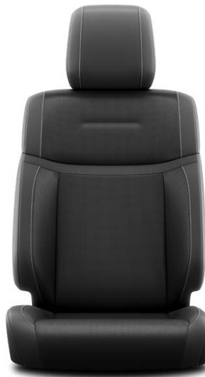
Форма: Премиум Цвет: Чёрный, Белый Материал: Комбинированный (замша + кожа) Комплектации: "Люкс HEV", "Люкс+ HEV"