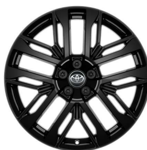
Легкосплавные диски 20" Комплектация: "STYLE"