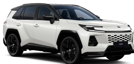
Белый жемчуг/чёрная крыша (2VP) 1

1 Только для комплектации "STYLE". Так же доступны в цветах: