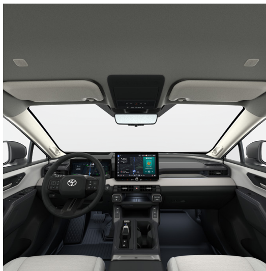
Интерьер: Белый (LA10) Акцентирующие элементы: Кожа (белый) Комплектации: "Люкс HEV", "Люкс+ HEV"