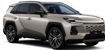
Бронзовый металлик (4V8)