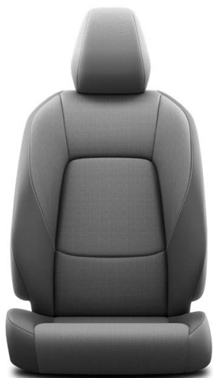
Форма: Стандарт Цвет: Чёрный Материал: Ткань "Меланж" Комплектация: "Престиж HEV"