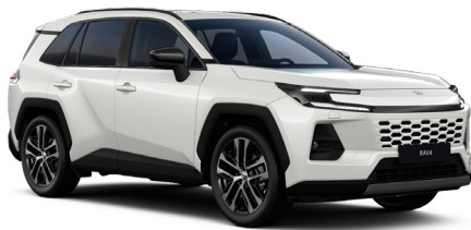
Белый жемчуг (089)