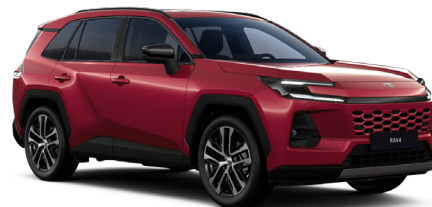
Красный металлик (3Т3)