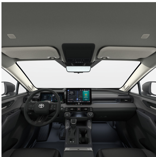
Интерьер: Чёрный (FA20,FB20,LA20, EC20) Акцентирующие элементы: Кожа (тёмно-серый) Комплектации: "Престиж HEV", "Style"