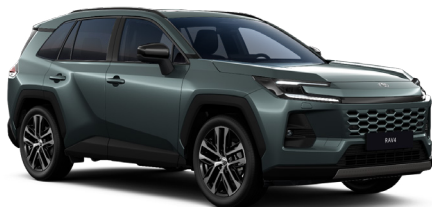
Зелёный металлик (6X7)