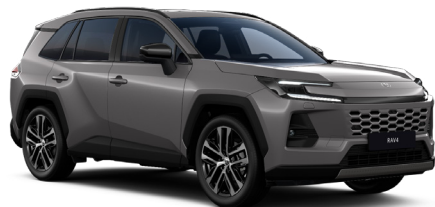
Светло-серый металлик (1M6)