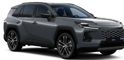
Серый металлик (1L6)