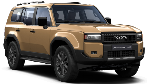
Құм түсті (5C8)