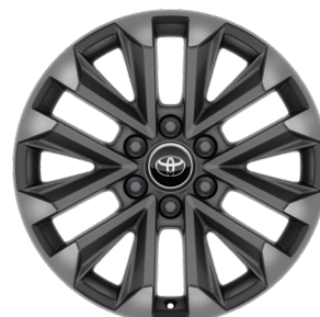
Жеңіл балқитын дискілер 20" "Люкс" және "Люкс+" жинақтамасы