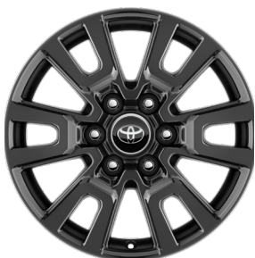
Жеңіл балқитын дискілер 18" "Комфорт" және "Комфорт+" жинақтамалары