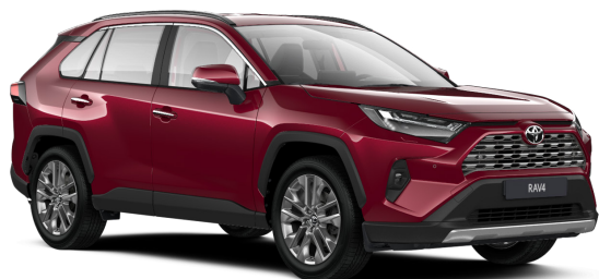
Красный металлик (3T3)