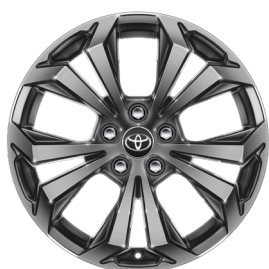
Легкосплавные диски 18" Комплектации "Престиж" и "Престиж+"