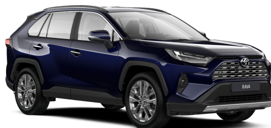
Тёмно-синий металлик (8X8)