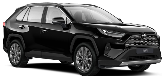
Черный металлик (218)