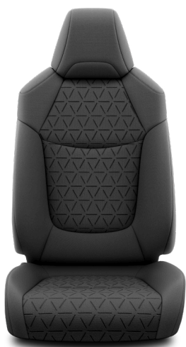
Отделка тканью чёрного цвета (FA20) Комплектации "Престиж" и "Престиж+"