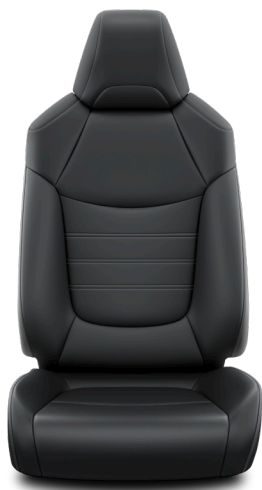
Кожа чёрного цвета (LA20) Комплектации "Люкс" и "Люкс+"