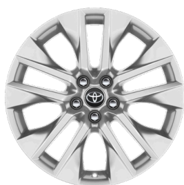
Легкосплавные диски 19" Комплектации "Люкс" и "Люкс+"