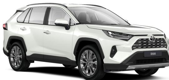
Белый жемчуг (089)