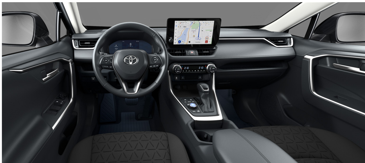
Отделка тканью чёрного цвета (FA20) Комплектации "Престиж" и "Престиж+"