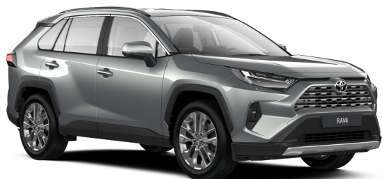
Серебристый металлик (1D6)