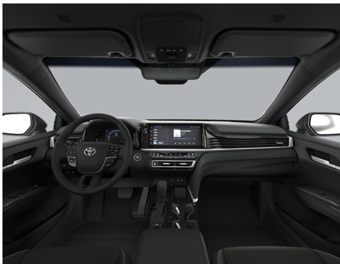
Отделка тканью чёрного цвета (FA20) Комплектация "Элеганс"