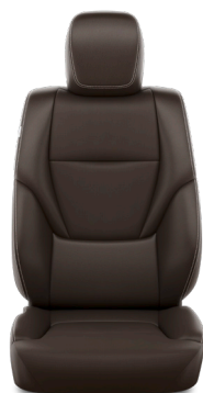
Искусственная кожа тёмно-каштанового цвета (EB40) Комплектации "Престиж"