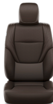
Кожа тёмно-каштанового цвета (LB40) Комплектации "Люкс" и "Люкс+"