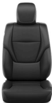
Искусственная кожа чёрного цвета (EB20) Комплектации "Комфорт", "Комфорт+" и "Престиж"