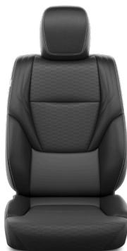
Кожа чёрного цвета (LB20) Комплектации "Люкс" и "Люкс+"