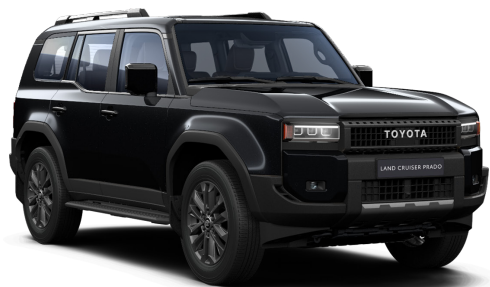
Черный металлик (218)