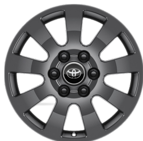
Жеңіл балқитын дискілер 18" "Престиж" жинақтамасы