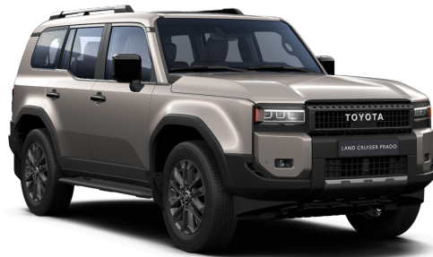
Қола түсті (4V8)