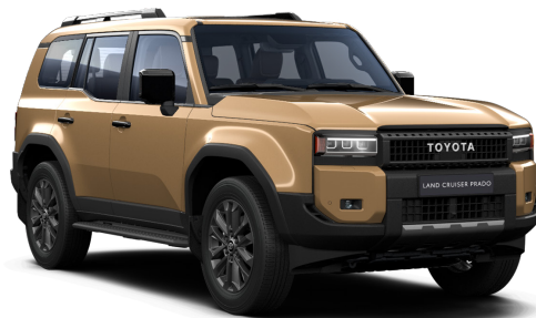
Құм түсті (5C8)