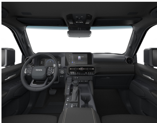
Қара түсті жасанды былғары (EA20) "Комфорт" жинақтамасы