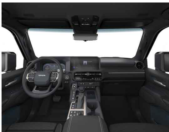
Қара түсті былғары (LB20) "Люкс" және "Люкс+" жинақтамасы