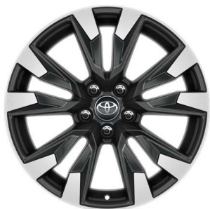
Жеңіл балқитын дискілер 18" "Комфорт", "Престиж" жинақтамалары