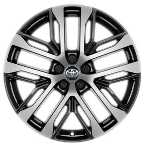
Жеңіл балқитын дискілер 20" "Люкс" жинақтамасы