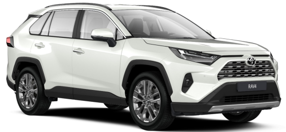
Ақ түсті маржан (089)