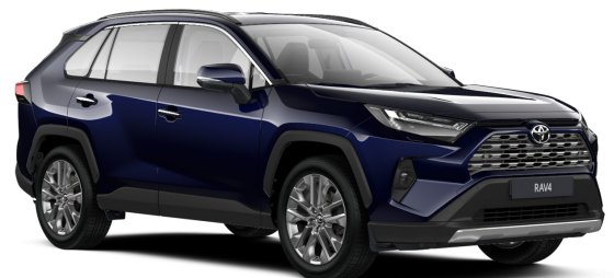
Көк металл (8X8)