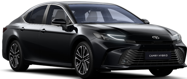
Қара металлик (218)