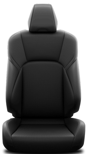
Қара түсті матамен әрлеу (FA20) "Элеганс" жинақтамасы