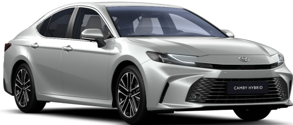
Күміс металлик (1F7)