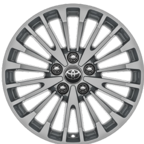
Жеңіл балқитын дискілер 17" "Элеганс" жинақтамасы