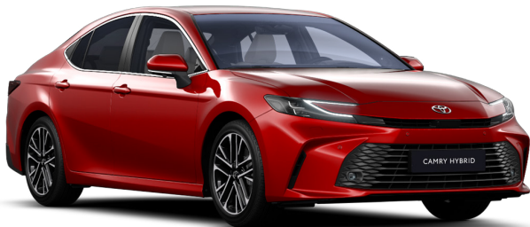
Қызыл түсті премиум (3U9)