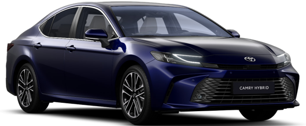
Қою көк металлик (8X8)