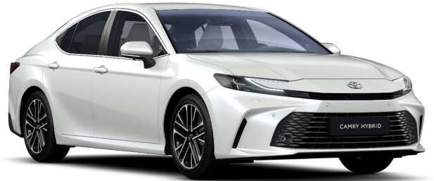
Ақ түсті маржан премиум (089)