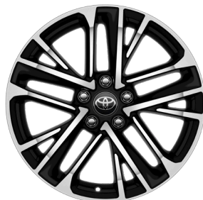
Жеңіл балқитын дискілер 18" "Престиж" және "Люкс" жинақтамалары