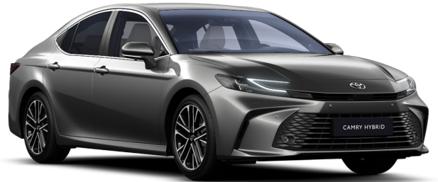
Күміс түсті премиум (1L5)