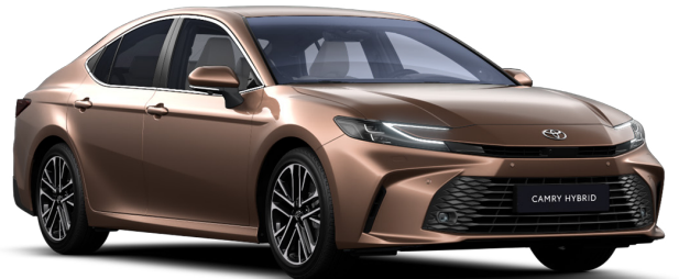
Қола металлик (4Y6)