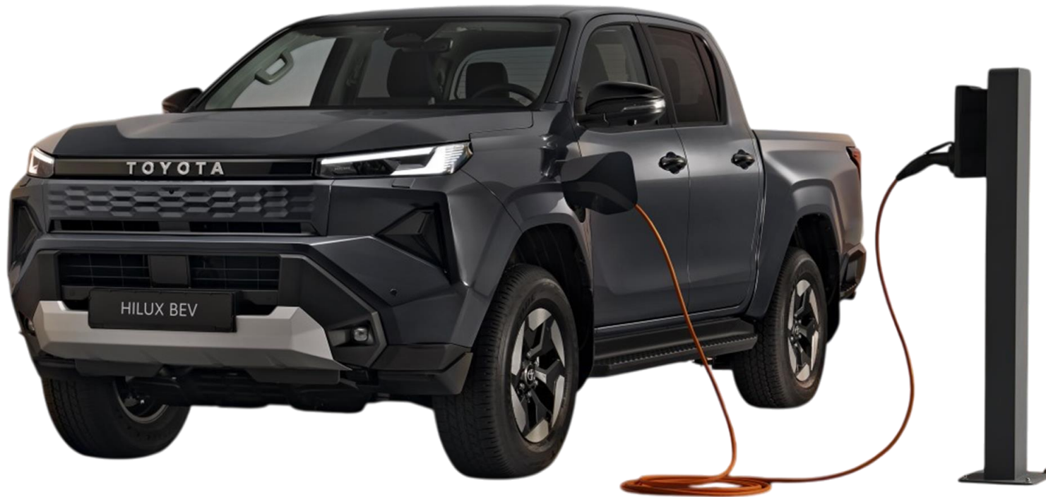
Immagine puramente indicativa

Listino N°: 1/26 Del: 19/05/2026 In vigore dal: 19/05/2026 Sostituisce N°: -