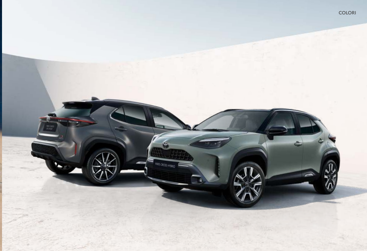
Opzioni monocromatiche Toyota Yaris Cross