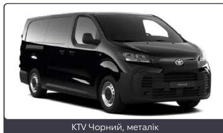
KTV Чорний, металік