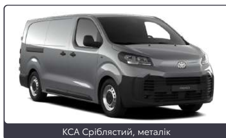
KCA Сріблястий, металік