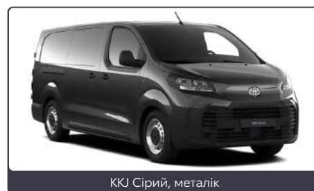
KKJ Сірий, металік