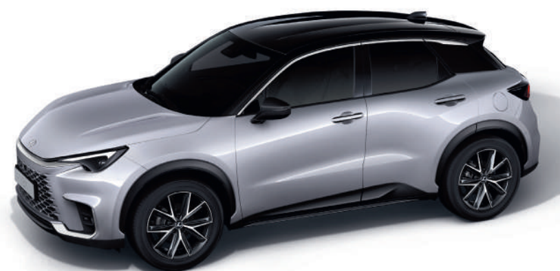
2LB Сріблястий/Чорний дах