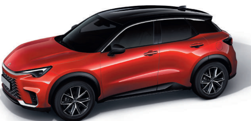
2TB Рубіновий/Чорний дах