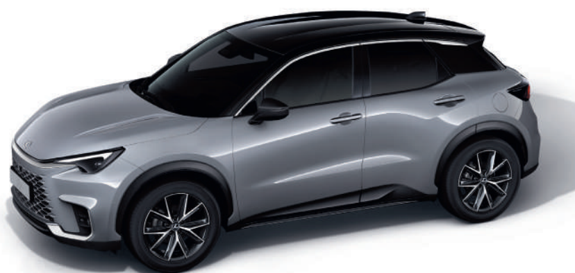
2YN Сірий цемент/Чорний дах