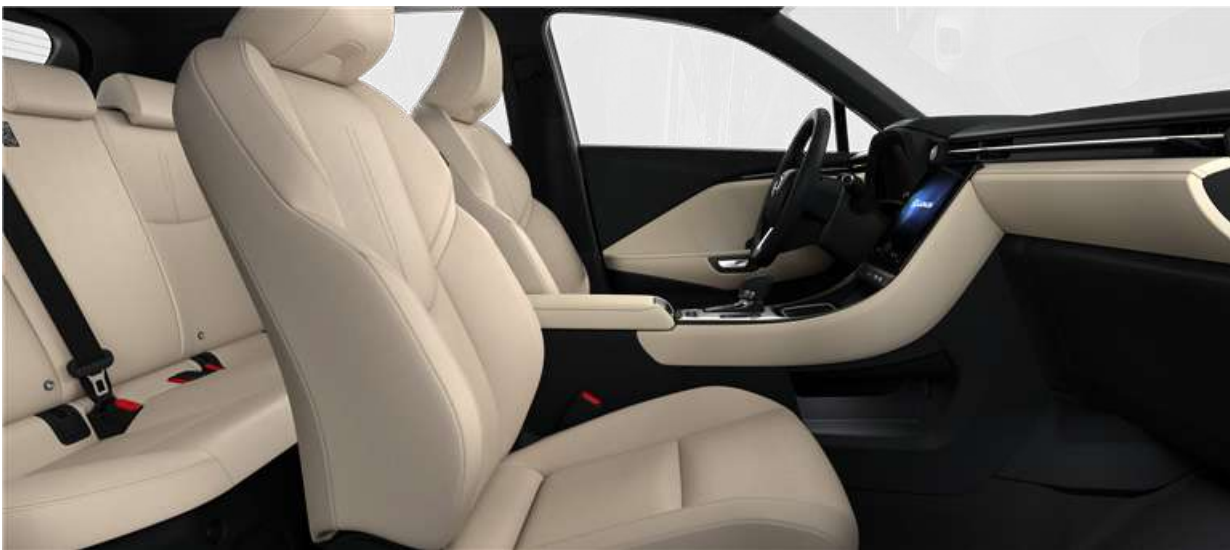
Бежевий EB00 (Комплектація Elegant)