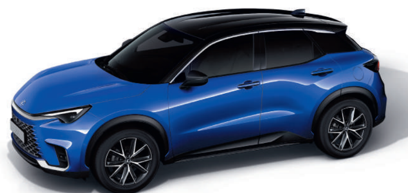
2VT Темно-синій/Чорний дах