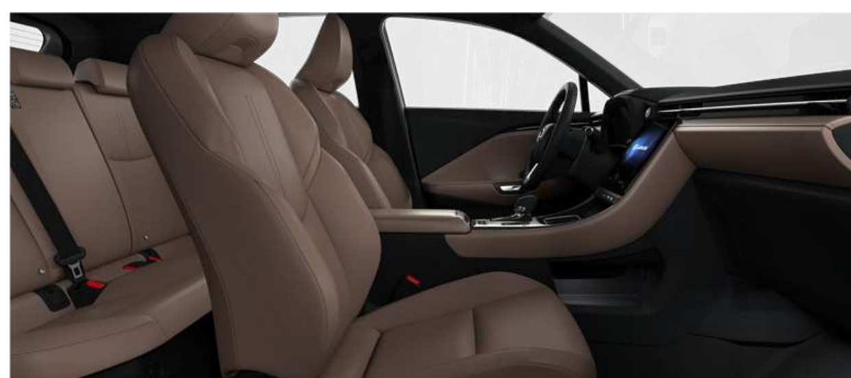
Коричневий EB41 (Комплектація Elegant)