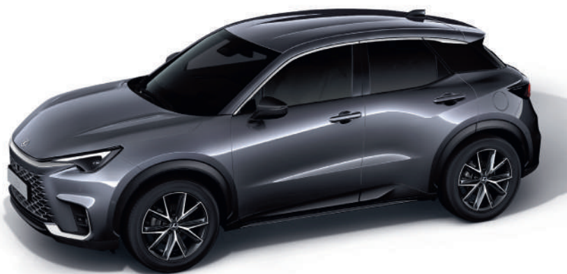
1L1 Хромовий сірий