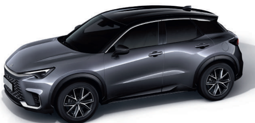
2YN Хромовий сірий/Чорний дах