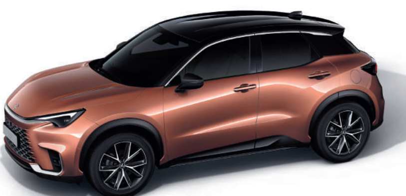
2YF Мідний/Чорний дах