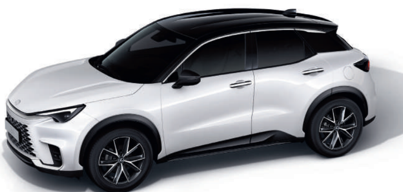
2YM Білосніжний/Чорний дах