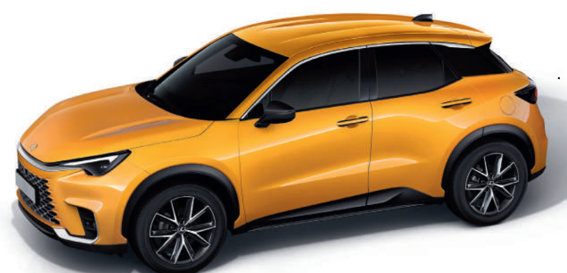
5A3 Пристрастний жовтий*