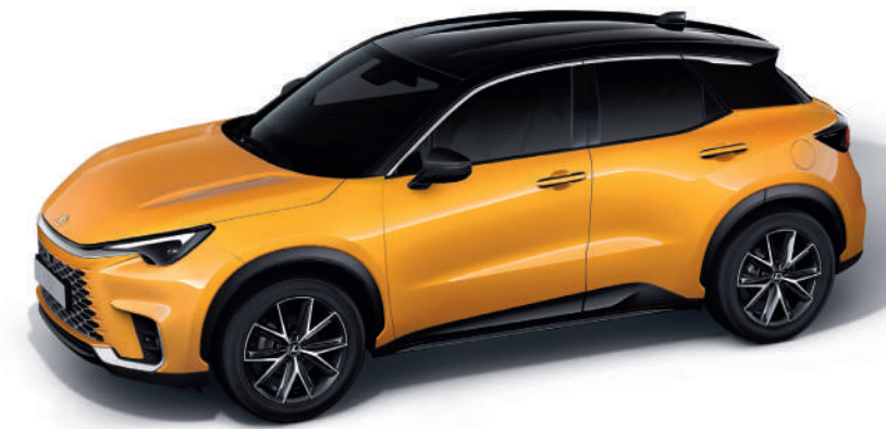
2PQ Пристрастний жовтий/Чорний дах*