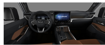
Коричневый с чёрными акцентами (LA41)*

Список комплектации представляет собой подборку наиболее важных параметров. Компания «Continent» оставляет за собой право изменять эту брошюру в результате ошибок, структурных изменений или сообщений от производителя без предварительного уведомления. Гарантия на автомобили Lexus: 3 года или 100 000 км пробега. Расход топлива и выбросы CO 2 автомобиля зависят не только от его энергоэффективности, но также от стиля вождения и других факторов не технического характера. Углекислый газ (CO 2 ) является основным парниковым газом, ответственным за глобальное потепление. Брошюра действительна до выпуска обновленного издания.