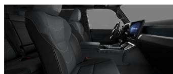
Тёмно-серый с чёрными акцентами (LA10/11)*