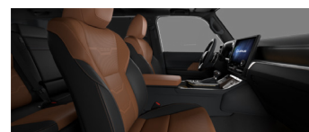
Коричневый с чёрными акцентами (LA40/41)*