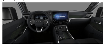
Чёрный с оливковыми акцентами (LC20)*