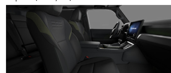
Чёрный с оливковыми акцентами (LC20/21)*