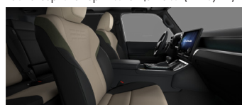
Песочный с чёрными и оливковыми акцентами (LC12/13)*