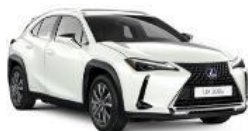
Sonic White (085)