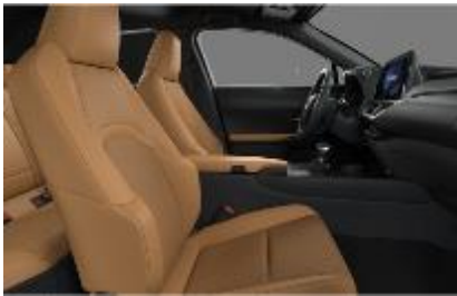
Piele mixta Hazel, plafon negru (LA42)