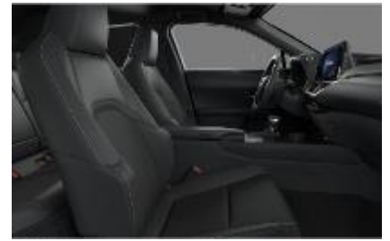
Piele mixta Black, plafon negru (LA20)