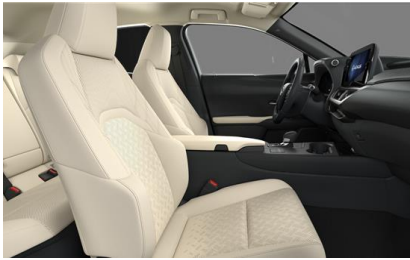
Smooth Leather Ammonite Sand (LA02)