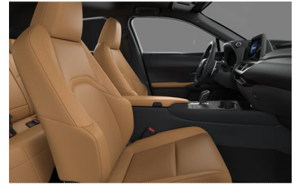
Perforated Synthetic Leather Hazel (EC42)