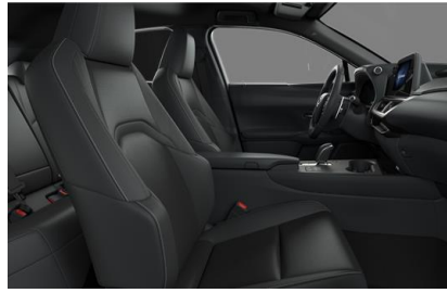
Perforated Synthetic Leather Black (EC20)