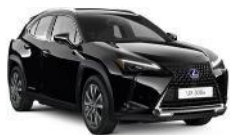
Solid Black (212)