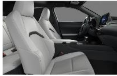
Piele mixta White Ash, plafon negru (LA10)