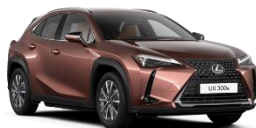
Sonic Copper (4Y5)