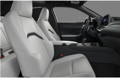
Perforated Synthetic Leather White Ash (EC10)