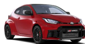
Rosu aprins** (3U5)