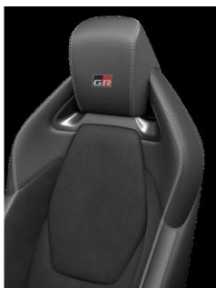
Stofa si piele sintetica (centura neagra si cusatura alba) (EA20)