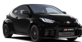
Negru Precious* (219)