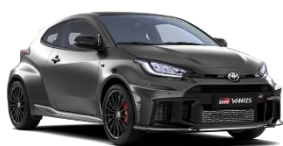
Cenusiu metal* (1L5)