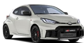
Alb Platinum** (089)