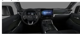
Чёрный с оливковыми акцентами (LC20)*