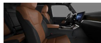
Коричневый с чёрными акцентами (LA40/41)*