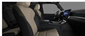
Песочный с чёрными и оливковыми акцентами (LC12/13)*