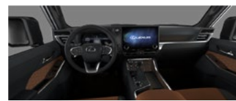
Коричневый с чёрными акцентами (LA41)*

Список комплектации представляет собой подборку наиболее важных параметров. Компания «Continent» оставляет за собой право изменять эту брошюру в результате ошибок, структурных изменений или сообщений от производителя без предварительного уведомления. Гарантия на автомобили Lexus: 3 года или 100 000 км пробега. Расход топлива и выбросы CO 2 автомобиля зависят не только от его энергоэффективности, но также от стиля вождения и других факторов не технического характера. Углекислый газ (CO 2 ) является основным парниковым газом, ответственным за глобальное потепление. Брошюра действительна до выпуска обновленного издания.