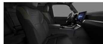
Чёрный с оливковыми акцентами (LC20/21)*